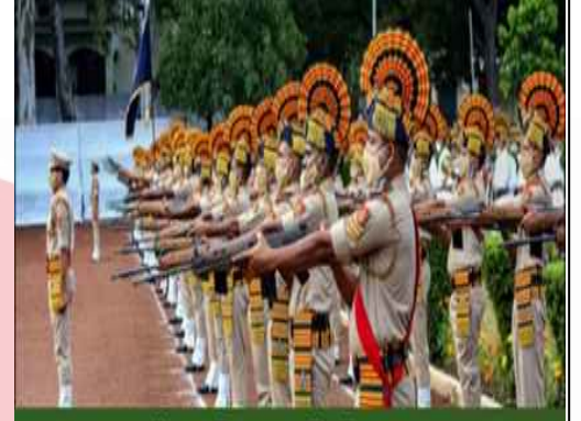
भारतीय पुलिस स्मृति दिवस 2024

पुलिस स्मृति दिवस, जिसे पुलिस शहीद दिवस भी कहा जाता है, हर साल 21 अक्टूबर को मनाया जाता है। यह दिन उन वीर पुलिसकर्मियों को श्रद्धांजलि देने के लिए समर्पित है जिन्होंने देश की सुरक्षा और शांति बनाए रखने के लिए अपने प्राणों की आहुति दी। इस अवसर पर देशभर में विभिन्न कार्यक्रम आयोजित किए जाते हैं, जहां वीरगति को प्राप्त पुलिसकर्मियों को सम्मानित किया जाता है। पुलिसकर्मी समाज के लिए एक महत्वपूर्ण स्तंभ होते हैं