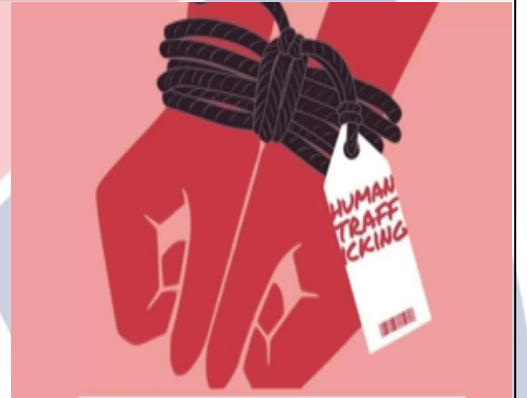
Human Trafficking Awareness Day

विश्व मानव तस्करी निरोधक दिवस हर साल 30 जुलाई को मनाया जाता है, जिसका उद्देश्य मानव तस्करी के प्रति जागरूकता बढ़ाना और इसे समाप्त करने के लिए किए जा रहे प्रयासों को समर्थन देना है। यह दिन मानव तस्करी के शिकार लोगों की पहचान करने, उन्हें सहायता और समर्थन प्रदान करने, और सरकारों और संगठनों द्वारा मानव तस्करी को रोकने के लिए उठाए गए कदमों को मजबूती देने पर केंद्रित है। मानव तस्करी एक गंभीर अपराध है जो मानवाधिकारों का उल्लंघन करता है।