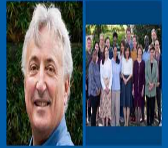
Professor Robert Costanza

जैव विविधता और पारिस्थितिकी तंत्र सेवाओं पर अंतर-सरकारी मंच (आईपीबीईएस) ने बताया कि वह 2024 ब्लू प्लैनेट पुरस्कार के लिए चयनित हुआ है। इस पुरस्कार को जापान के असाही ग्लास फाउंडेशन द्वारा वार्षिक रूप से वैज्ञानिक अनुसंधान और उनके अनुप्रयोग में उत्कृष्टता को मान्यता देने के लिए प्रदान किया जाता है। यह पुरस्कार वैश्विक पर्यावरणीय समस्याओं के समाधान में मदद करता है। इसमें 500,000 डॉलर की राशि शामिल है।